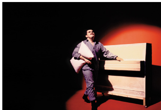
Jordi Colomer, Eldorado , 1998 © ADAGP, Paris

Du 14 décembre 2012 au 3 février 2013, l'Institut d'art contemporain présente :