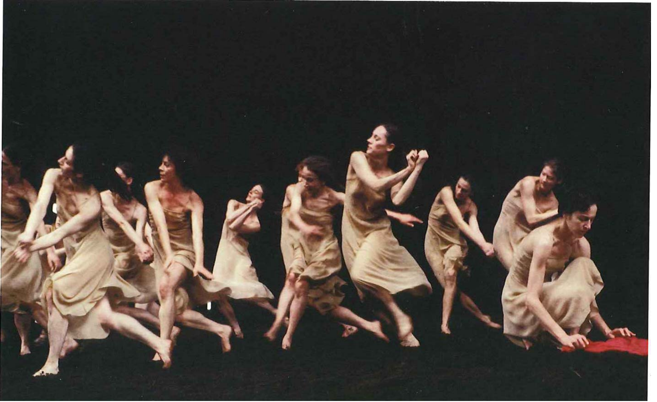
" Le sacre du printemps ", Pina Bausch, 1975