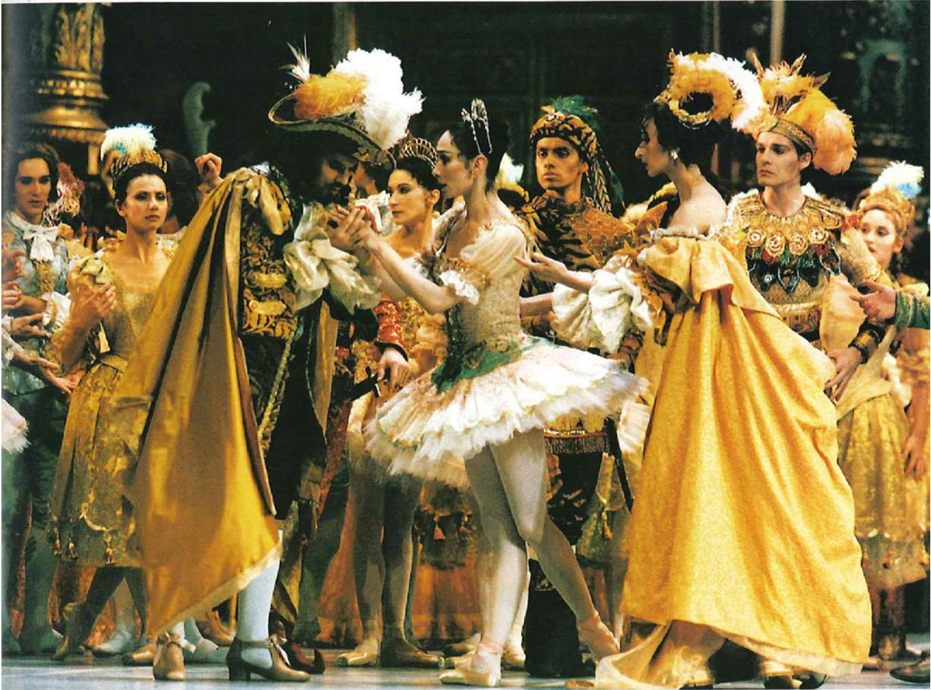
Pantomime " La belle au bois dormant "