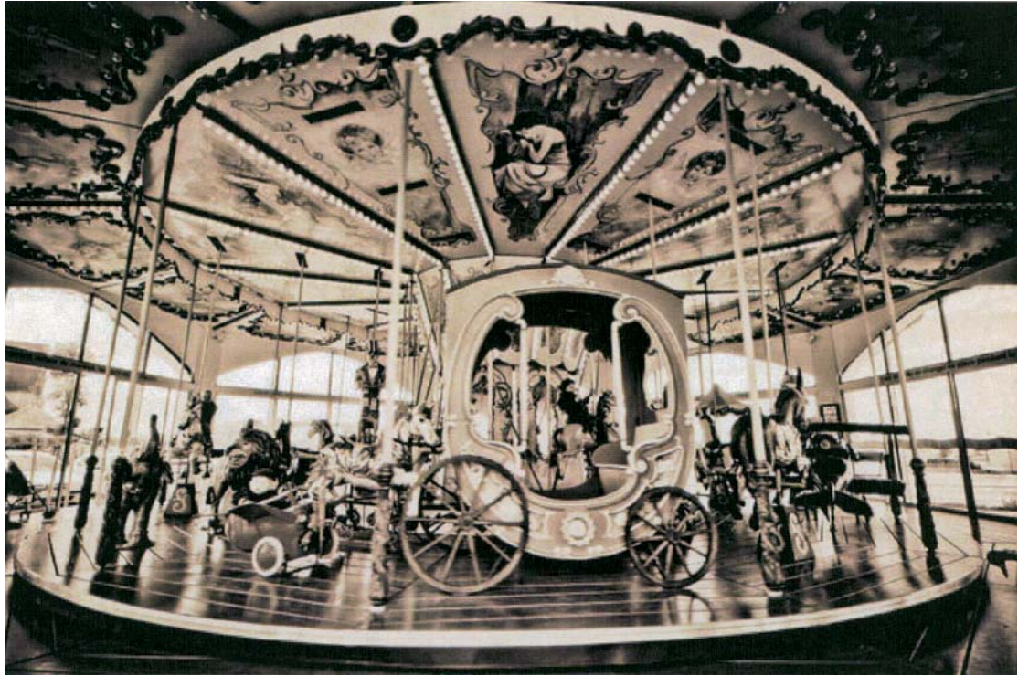
Sébastien Moreau, Tournez manège , photographie, 2012.