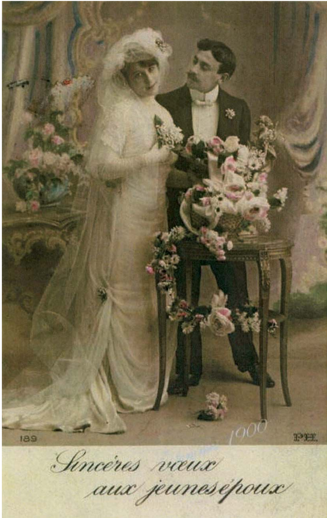
Carte postale de vœux pour un mariage, 1900.