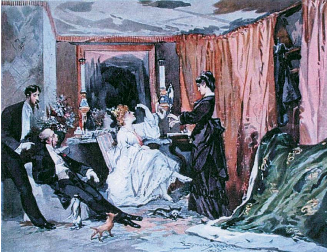
Edmond Morin, La Loge d'Hortense Schneider au théâtre des Variétés , aquarelle, 0,237m X 0,301m, fonds de dessin du château de Compiègne, 1873.