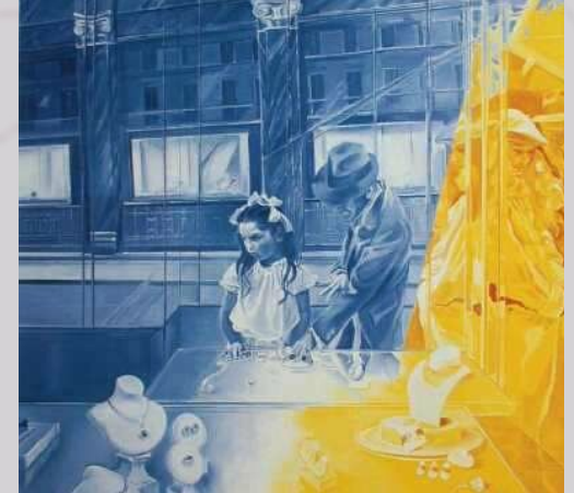
la tapisserie de Bayeux, 11 ème siècle Piero della Francesca, La flagellation du Christ - 1455 Jacques MONORY, Meurtre N°2 , 1968 Jacques MONORY, la-voleuse n3 , 1986