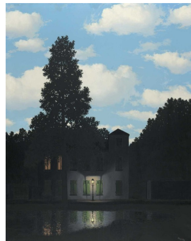
René Magritte, L'empire des lumières, 1954, huile sur toile

- Avec quelle technique l'artiste a-t-il créée cette oeuvre?