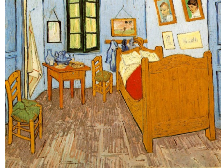
La chambre de Van Gogh à Arles (chambre de Van Gogh à Arles) 1889, peinture à l'huile

Tu peux aussi faire des recherches d'images sur internet ou utiliser la fiche ressources ci-jointe.