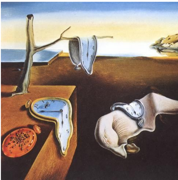
La persistance de la mémoire, Salvador Dali, 1931, Peinture à l'huile

Le Surréalisme est un mouvement littéraire puis artistique qui apparut après la Première Guerre Mondiale. L'écrivain et poète André Breton en est un des initiateurs. Le mouvement refuse la construction logique de l'esprit et repose sur les valeurs de l'absurde, du rêve et de l'inconscient.