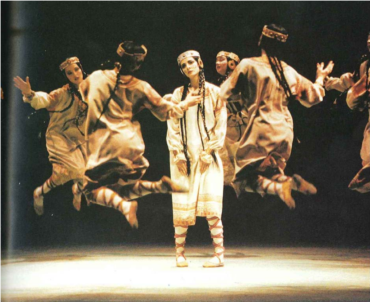
Vaslav Nijinski, Le Sacre du printemps, 1913