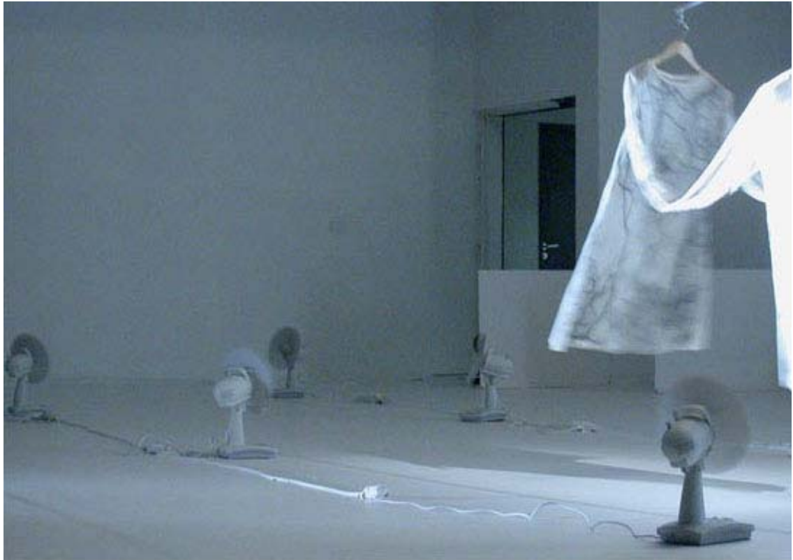
Christian Rizzo, 100 % Polyester - Objet dansant, 1999