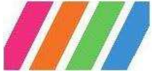
Schéma cycle 3