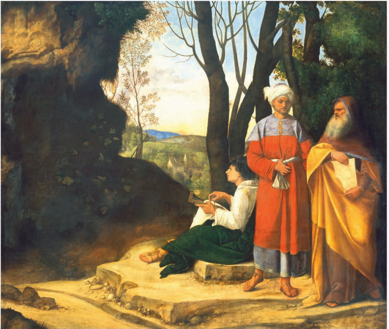
1. GIORGIONE (Giorgio Barbarelli dit), Les trois philosophes , 1505-1509, huile sur toile, 123 x 144 cm. Musée des Beaux-Arts et d'Archéologie, Vienne.