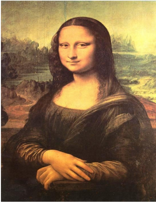
Léonard DE VINCI La Joconde 1506, Huile sur toile

Mon projet : Je réalise un croquis de mon projet et j'explique en une phrase mon idée :