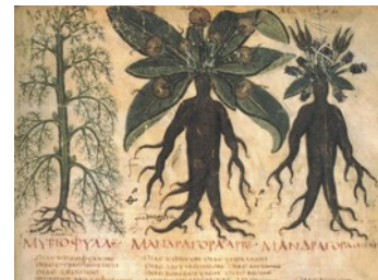
Illustration ancienne d'une mandragore