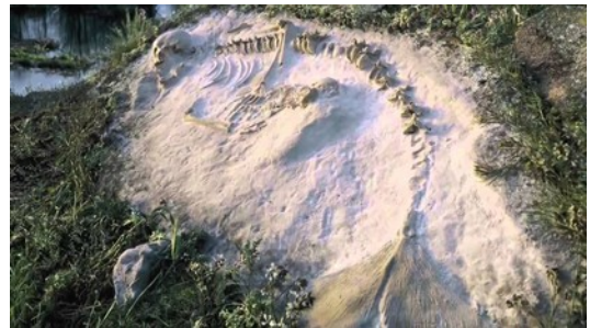
Joan Fontcuberta, Le chant des sirènes 2014