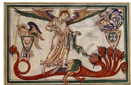
Enluminure du Moyen âge

Pour aller plus loin ou trouver des images d'oeuvres inspirantes, lecture d'un dossier pédagogique à propos des cabinets de curiosités: http://arts-plastiques.spip.ac-rouen.fr/IMG/pdf/dossiers_pedagogiques_cabinets_de_curiosites_8_3_mo.pdf