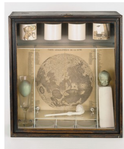
Joseph Cornell, 1936, boîte