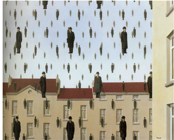
René Magritte, Golconde , peinture à l'huile, 1953