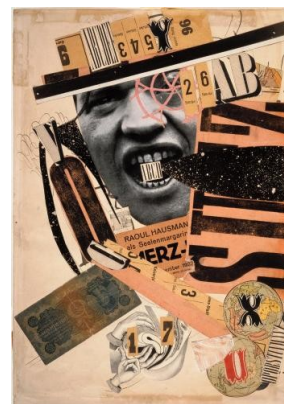
Raoul Hausmann, ABCD , 1923-24