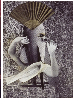
Max Ernst, Le rossignol chinois , photomontage, 1920