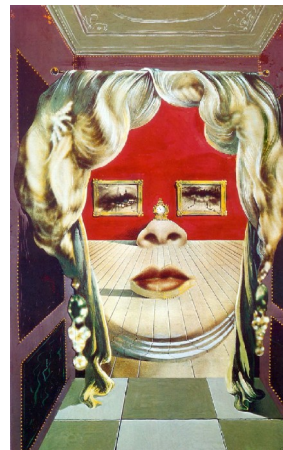
Salvador Dalí, Visage de Mae West , peinture à l'huile, 1934-35